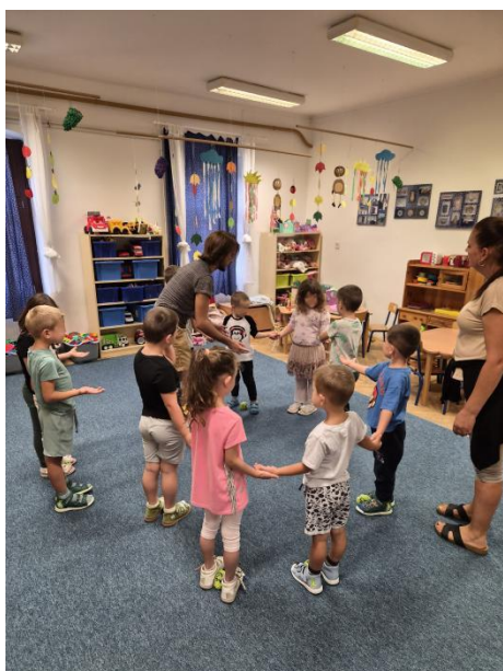
Egymásnak is segítő kicsik